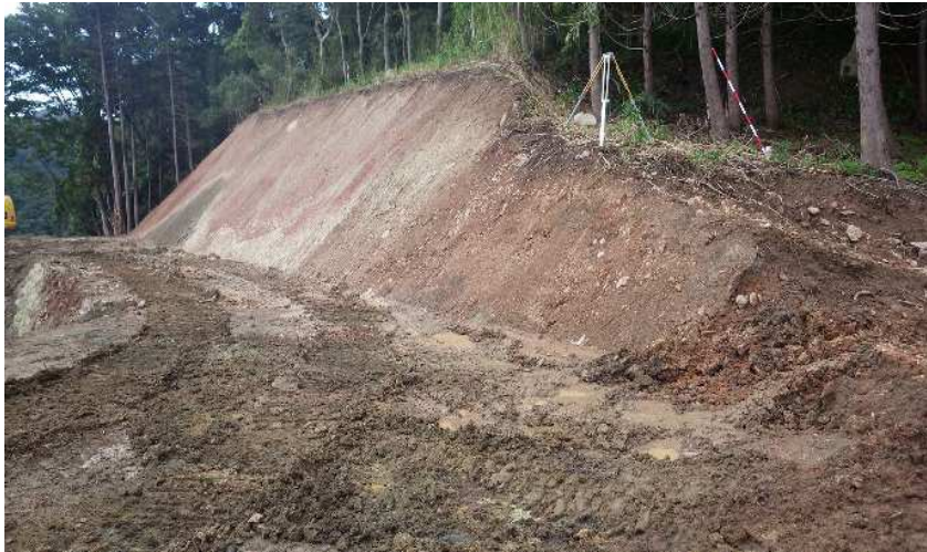
法面最上段 整形完了